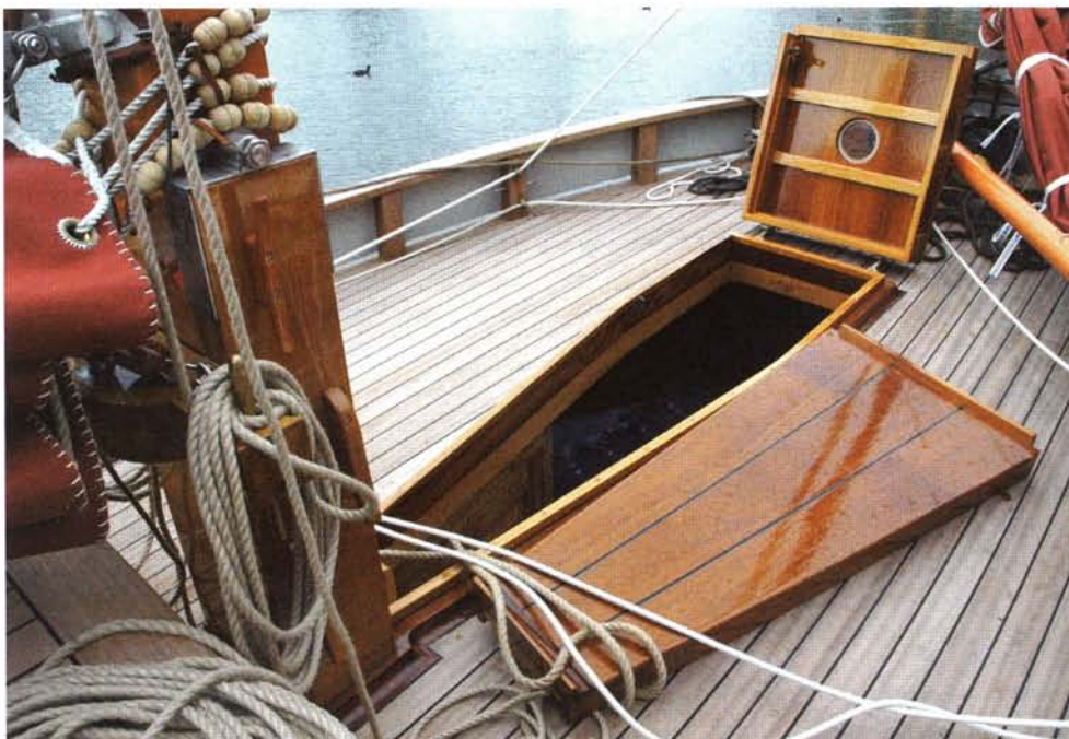
De uitwip voor de gemakkelijke strijkbare mast.

We denken dat er wat waterplanten in de schroef gedraaid zijn waardoor de motor is vastgeslagen, maar Peter weet hem weer