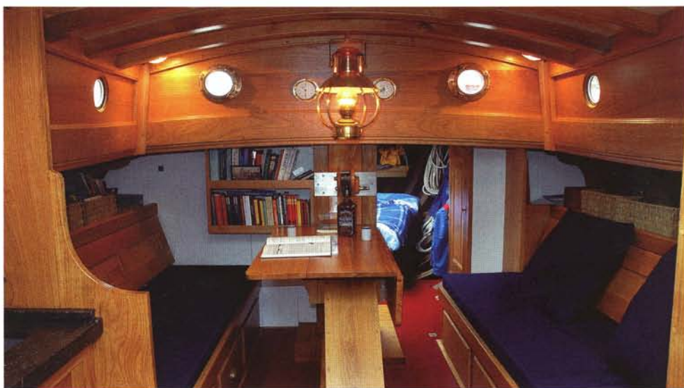
De gezellige kajuit. Foto Theo Kampa.

Tegen het ochtendgloren begint het flink op te briesen en Peter trekt een rif in het grootzeil. Bij het dagworden neemt George het helmhout over en Peter komt ook boven. De mannen zitten met zoute haren in de kuip aan de koffie en na een laatste blik in de kaart ga