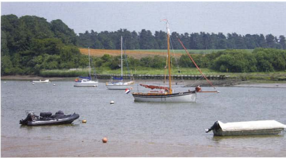
Voor anker bij Woodbridge.