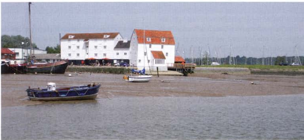
Tide Mill Woodbridge.